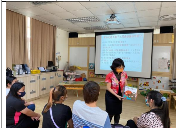
講師分享親子共讀的理論與實務:共讀 技巧，並且與家長實作互動