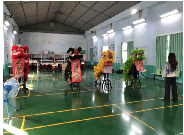
說明：學生參加方案舞獅課程進行