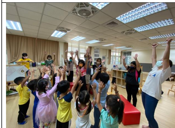
親子健康默契舞蹈同樂~ 舞出健康、幸福和愛