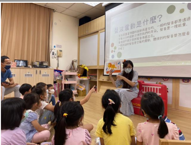
故事《小蛇散步》與聲波科學實驗