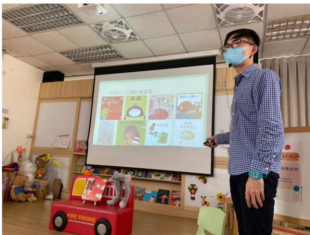
情緒繪本與故事，協助認識、調節情緒