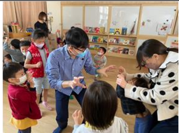
講師以戲劇遊戲鼓勵家長與幼生一起練習情緒表達