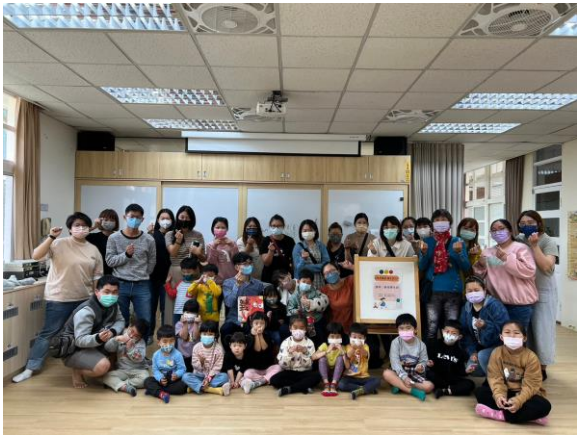
有獎徵答-親子組合領取獎品合照