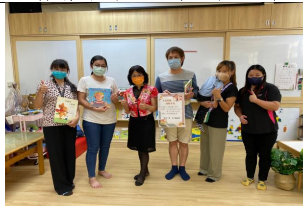
播放「我和我的孩子」互動影片，介紹家長版 手冊後 Q&A，並讓家長把小禮物繪本帶回家。