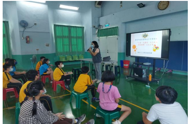
說明：毒品防制宣導議題