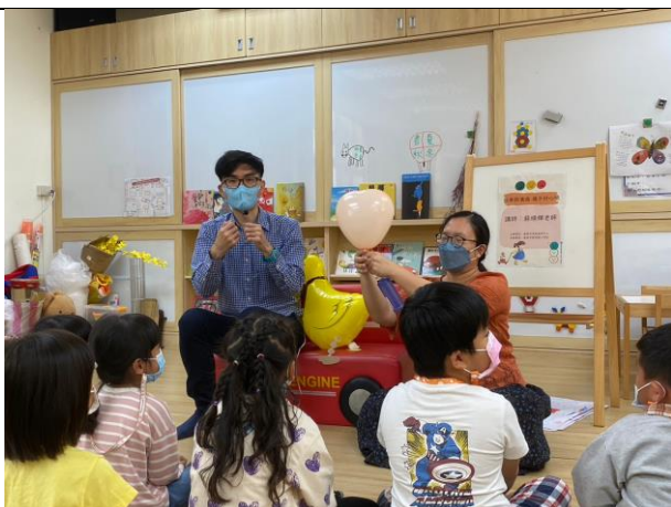
情緒撕貼畫分享與情緒調節氣球運用