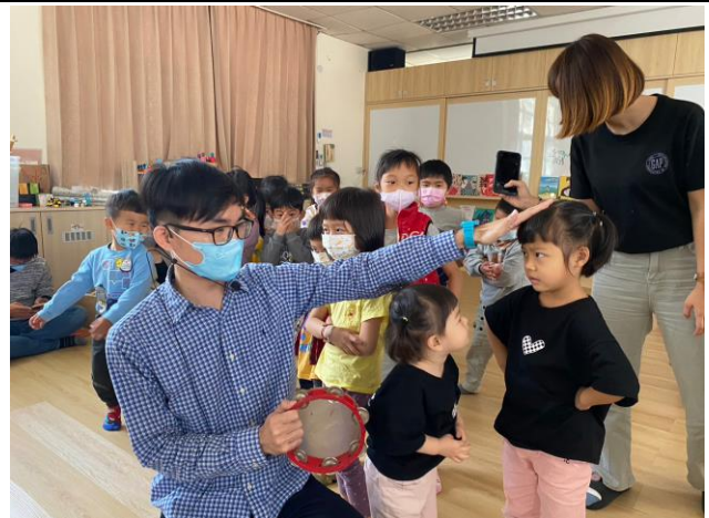
音樂律動遊戲與情緒表達/調節實作