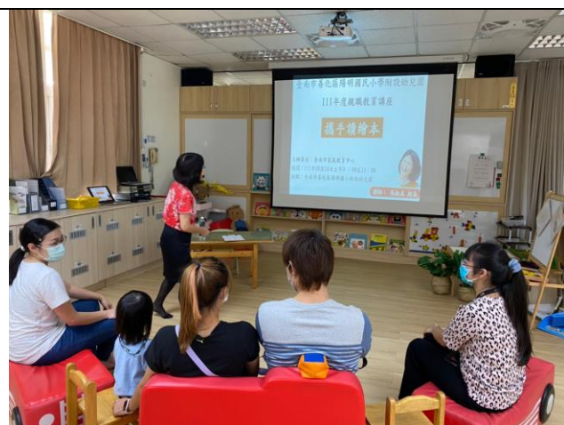
講師介紹臺南市家庭教育中心的目 的、功能、服務跟家庭教育相關訊息