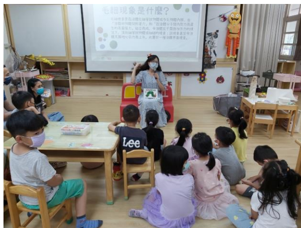
STEAM 教育理論、繪本《好餓好餓的 毛毛蟲》及幼兒 STEAM 親子互動示範