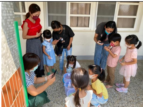
親子分組手作毛細現象-開花實驗