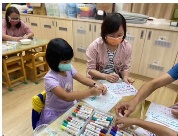
親子手作毛細現象-毛毛蟲實驗