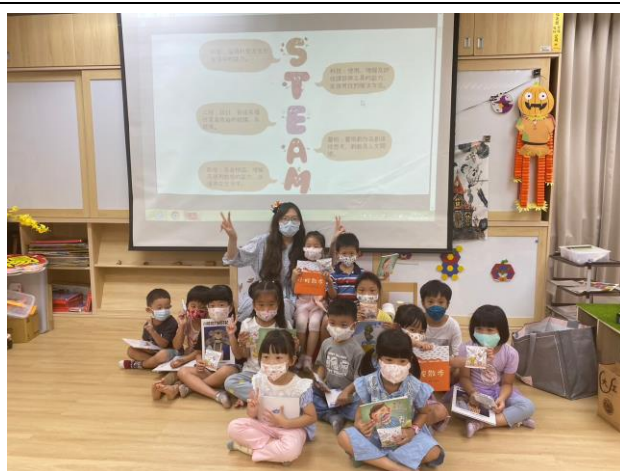
教養有獎徵答-繪本、教材帶回家運用