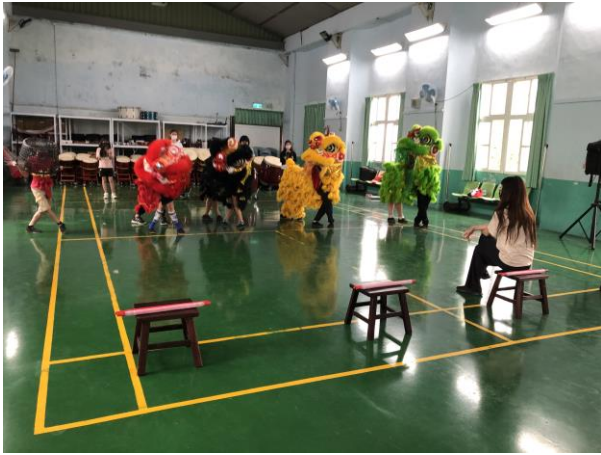
說明：學生參加舞獅課程進行