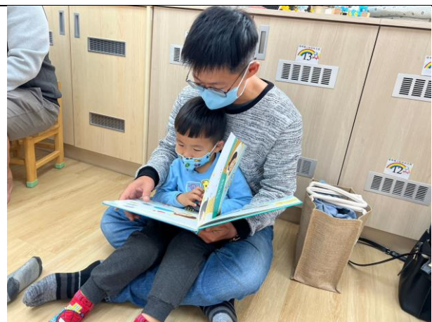
親子情緒繪本共讀

備註：請將成果報告表上傳至 http://163.26.86.121:5000/sharing/seVMARCKp