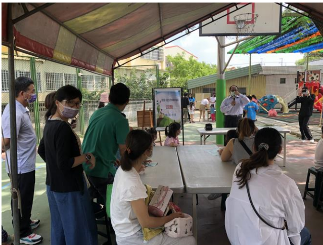
說明：親職教育講座