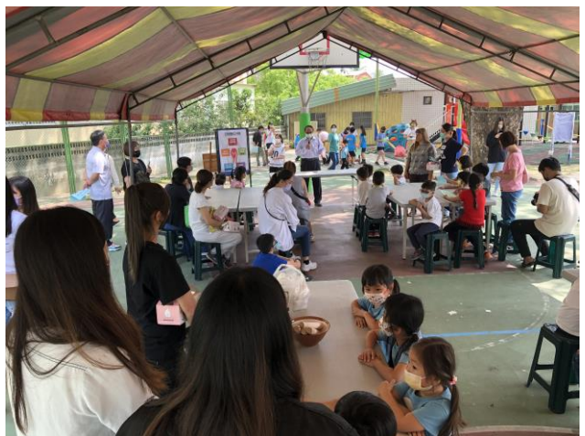
說明：親職教育講座