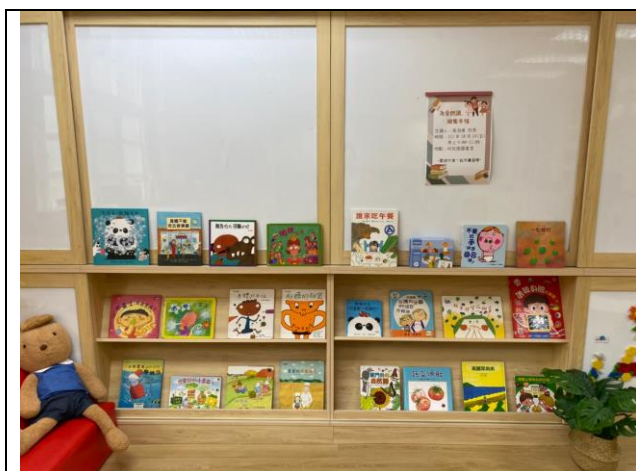
活動場地與情境佈置 結合本次「健康促進」繪本主題