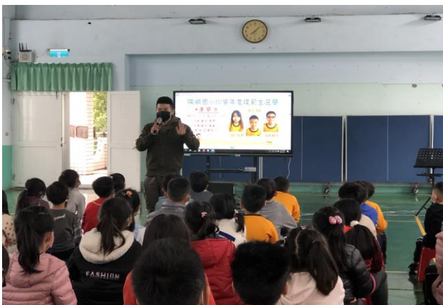
說明：反賄選宣導議題