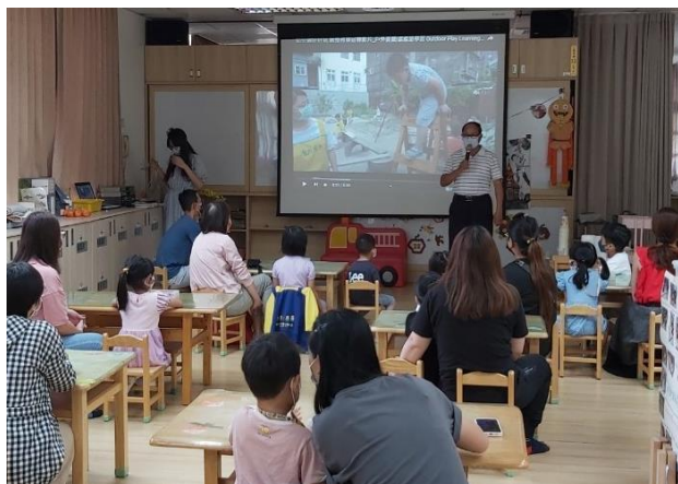
教育部正常化教學影片撥放、校長介紹 講師與校園親職活動推廣